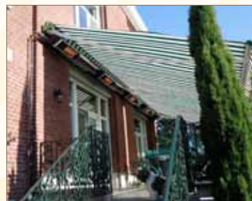
Długi sezon sprzedaży: również wiosną i jesienią Dla osób prywatnych - tarasy