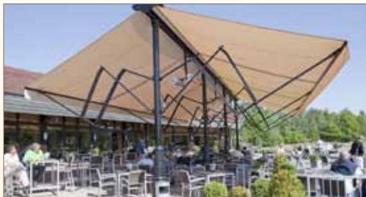
Urządzenia wpasowane w styl i otoczenie

Niewielkie wymiary, łatwy montaż na ścianie, pod markizą lub baldachimem.